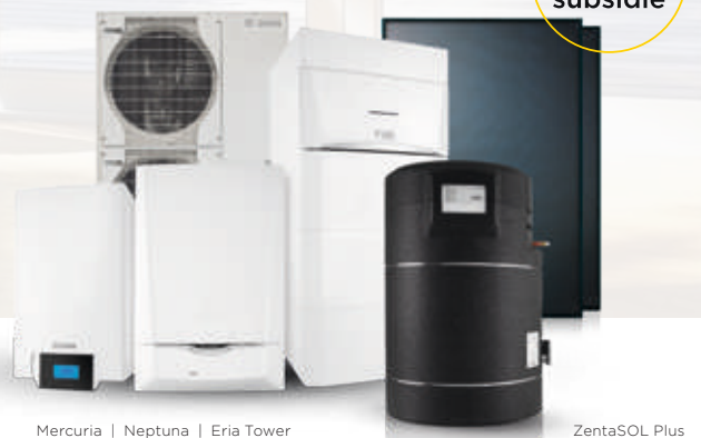
Mercuria | Neptuna | Eria Tower